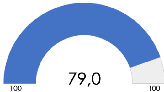
SCORE DE RECOMMANDATION MOYEN